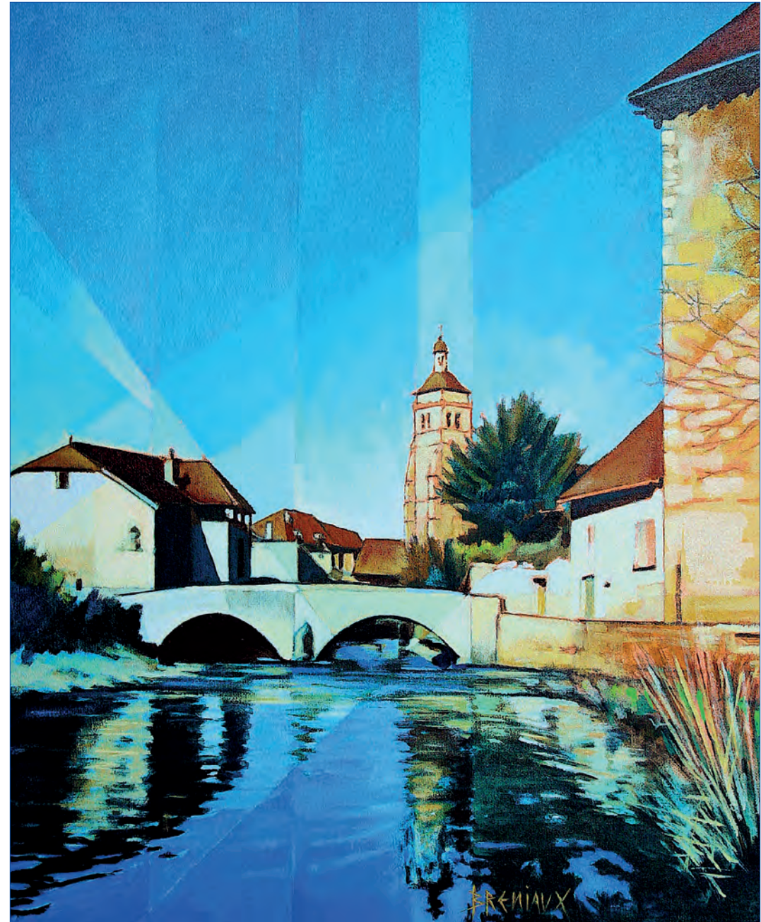
«La Cuisance depuis la tour Gloriette», huile sur toile 2012, 92 x 73 cm